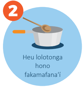
Heu lolotonga hono fakamafana'í