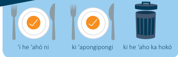
'i he 'ahó ni ki 'apongipongi ki he 'aho ka hokó

KAI IA 'I LOTO 'I HE HOUA 'E 24 'I HO'O A'U KI 'API