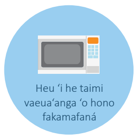
Heu 'i he taimi vaeua'anga 'o hono fakamafana'í